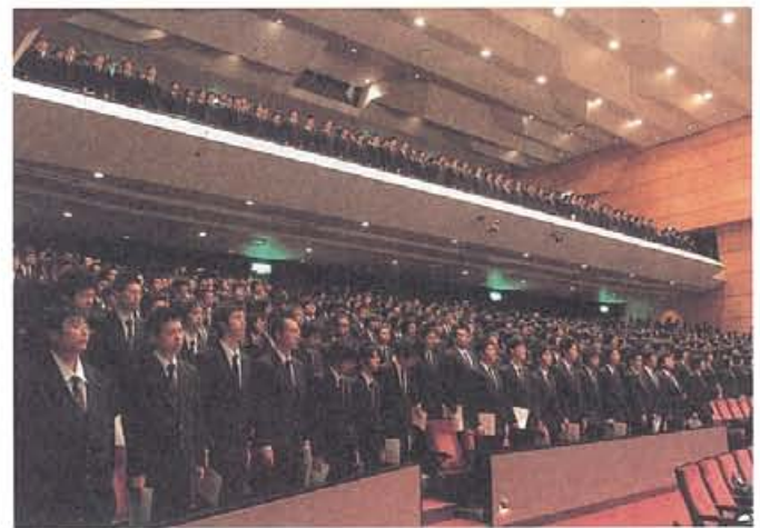
在校生も立派な態度で式典に臨む。