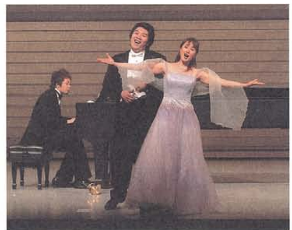
3名の同窓生による演奏、意外だがこの日が初めてのコラボレーション。