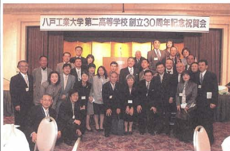
各世代の同窓生、現職員、旧職員の方々も一緒に。