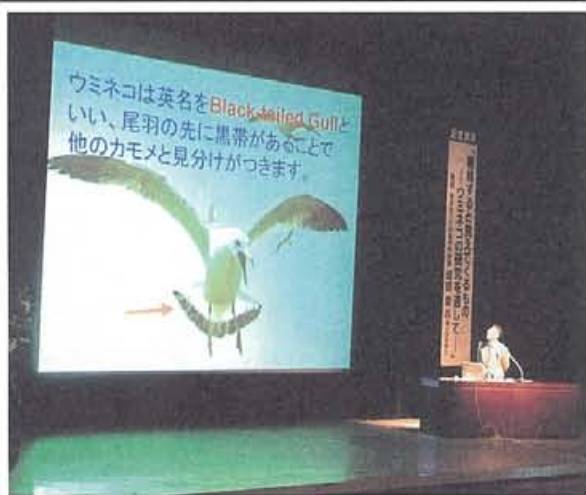
私達の知らなかったウミネコの生態が次々と...