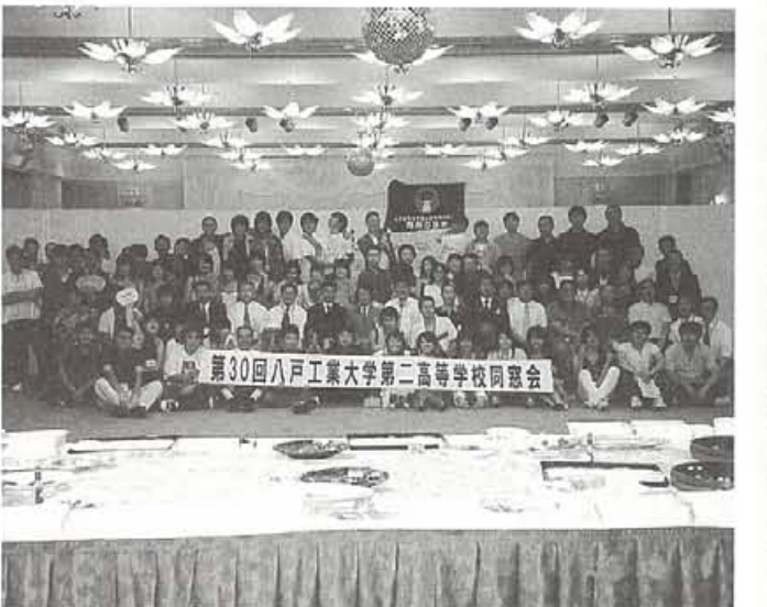
第30回八戸工業大学第二高等学校同窓会