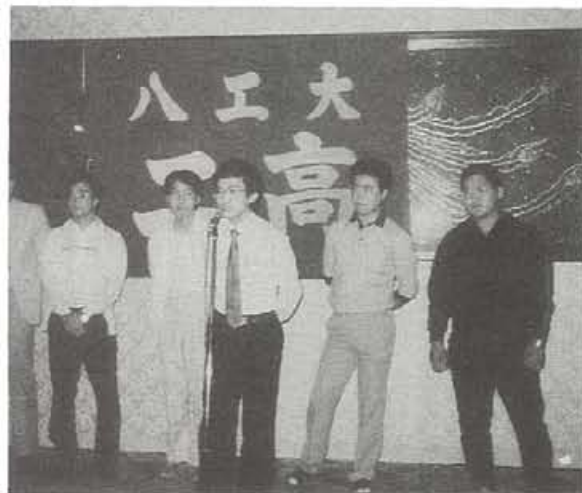
第1回同窓会総会（昭和51年8月14日）

十数年前のことでした。その時の仕事は卒業生の同窓会入会式と夏の同窓会だけでしたので同窓会会長の役を引き受けました。同窓会会長の役も、もう少しで二十年です。しばらく score にこだわります。