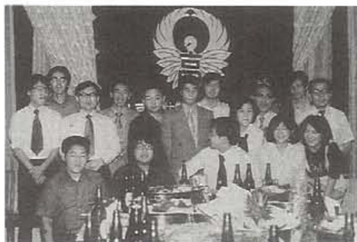
関東支部同窓会発足式(昭和53年5月27日)