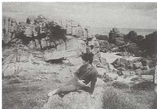
種差海岸の人魚男

ともあれ、同窓生の未来に栄光あれ。そして、二高よ、永遠に。(学校法人八戸工業大学 法人事務局勤務)