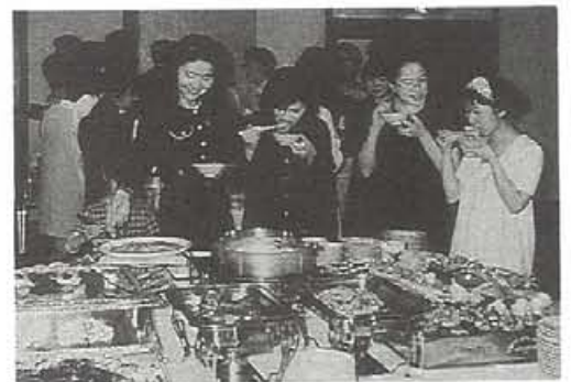
関東支部同窓会 (平成7年5月20日)

ている総会への出席者数は横這い状態にあります。出席者のうち専ら新会員(当年三月卒業し上京した会員)が六〇〜七〇%を占め、それ以前の入会者の参加が減少していることがはつきりわかります。